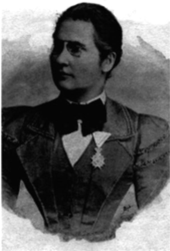
ЈЕЛЕНА ДИМИТРИЈЕВИЋ Крушевац, 1862 – Београд, 1945. (фотографију обезбедио Ђорђе Перинћ)

(фотографију обезбедио Ђорђе Перинћ) ЈЕЛЕНА ДИМИТРИЈЕВИЋ 1862 – 1945