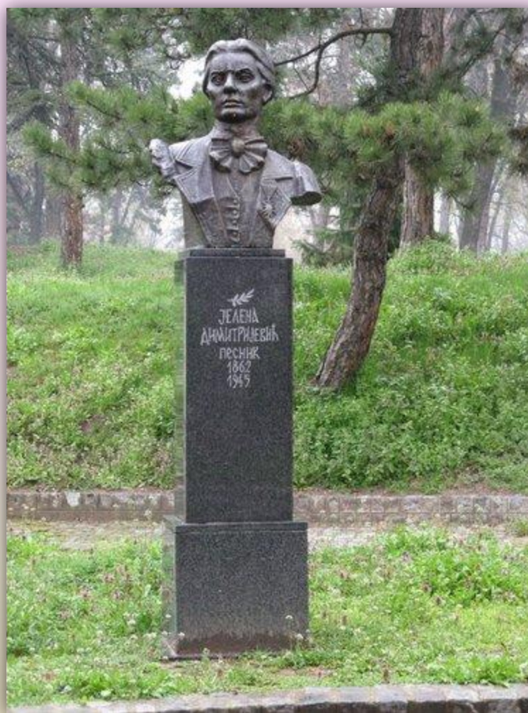
Ниш, Тврђава, споменик Јелени Димитријевић (1862-1945)